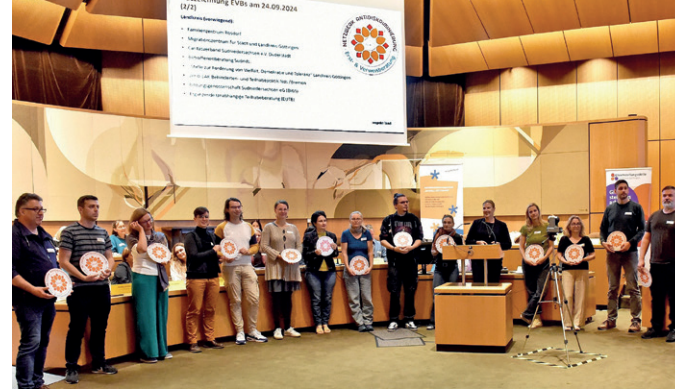
Gruppenfoto und Auszeichnung der EVBs

Beim dritten Netzwerktreffen am 29.08.2025 ging es darum, in einem Podiumsgespräch zusammen mit Heike Fritzsche von der Antidiskriminierungsstelle des Bundes das Erreichte darzustellen. Sie hob die Besonderheit des interkommunalen Modellprojektes mit starker zivilgesellschaftlicher Beteiligung besonders hervor.