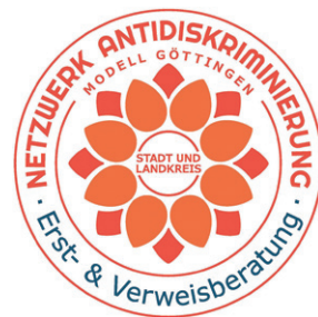
Die EVB-Plakette, deren Gestaltung an die „Netzwerkblüte“ angelehnt ist

Im Landkreis fungieren als EVB-Stellen oftmals Einrichtungen, die aufgrund ihres niedrigschwelligen Angebotes (u. a. der Beratung in unterschiedlichen Lebenslagen) oder aufgrund ihrer Angebote für Familien (wie z. B. Familienzentren oder Mehrgenerationenhäuser) eine breite Bevölkerung erreichen. Unter den Erst- und Verweis-