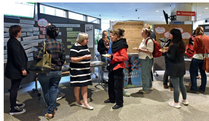
Austausch und Vernetzung während des „Markt der Möglichkeiten“

Anschließend wurde das Folgeprojekt „Vielfalt sichert Zukunft“ vorgestellt.