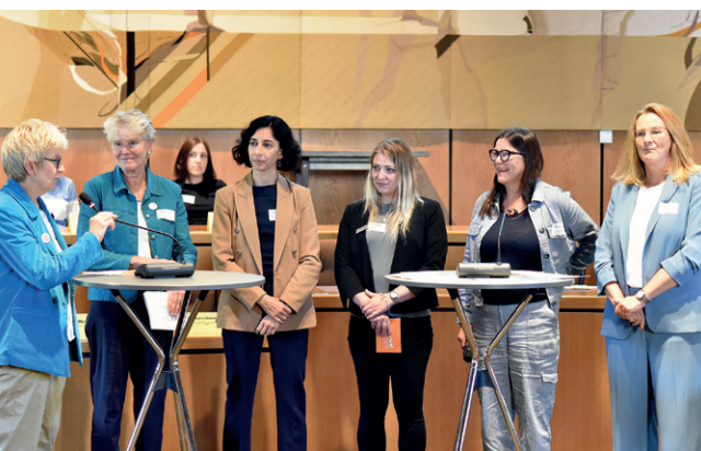
Gesprächsrunde auf dem Podium

Aktuell zählt das „Netzwerk Antidiskriminierung“ rund 80 Mitgliedsorganisationen aus Stadt und Landkreis Göttingen. Laut Netzwerkbefragung handelt es sich hierbei um folgende regionale Aufteilung: 62 Prozent in der Stadt, 24 Prozent im Landkreis und 14 Prozent in sonstigen Regionen.