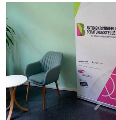
Beratungsraum des VNB

Für die Trägerauswahl für eine AD-Beratungsstelle , die horizontal ausgerichtet ist und nach den Standards qualifizierter AD-Beratung des advd arbeitet, erarbeitete die Steuerungsgruppe im Jahr 2023 Kriterien und eine Ausschreibung zur Interessenbekundung. Nach der Feststellung von der Eignung des Verein Niedersächsischer Bildungsinitiativen e.V. (VNB) erhielt dieser im März 2024 den Zuschlag. Die AD-Beratungsstelle wurde mit einer erfahrenen und qualifizierten AD-Beraterin besetzt und hat im August 2024 die Arbeit in der Göttinger Geschäftsstelle des VNB aufgenommen.